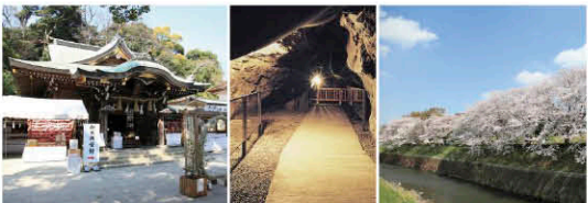
留学生・技能実習生たちから名前の挙がった場所。左から江島神社(辺津宮)、岩屋、円行の桜