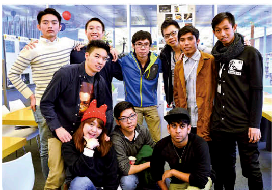
出身地は、アメリカ、インドネシア、香港、マカオ、イタリア、スリランカ、シンガポールとさまざま

外国から来た人の目には藤沢はどう映っているのだろうか? 多摩大学グローバルスタディーズ学部の留学生と、同大学と交流のあるシロキ工業藤沢工場の技能実習生に伺った。留学生はアジアを中心とした8名が、技能実習生はインドネシアから来た2名が答えてくれた。 外国人観光客に藤沢のどの点をPRすべきかについては、「江の島」を挙げる人が多数。岩屋の洞窟や江島神社など、自然や日本文化、歴史を二度に感じられる点に引かれるように、「春なら引地川沿いの桜がおすすめ。目黒川よりゆつくり見られる」と答えた人もいた。課題については「路線図の表記が漢字メインでわかりづらい」「鉄道の乗り換え口が複雑」「市内にごみ箱が少ない」という声も聞かれた。イスラム教徒の人からは、「飲食店にハラール(※)の認定マークがある」と安心して食べられる」という意見も。そのほか「座禅など日本文化を体験できる場所をもっとPRする」といいという提案も挙がった。 ※ハラール:イスラム法で許可されたものを指す。イスラム法の律法に則った食べ物、商品などには認定マークがつけられる。