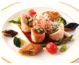
▲1皿2,500円 (2人盛り) ☎0463 (61) 7813 大磯プリンスホテル 「中国料理 李芳」