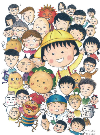
30周年原画展用イラスト(2014年) ©MOMOKO SAKURA ©SAKURA PRODUCTION