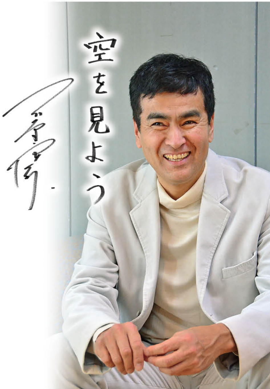
俳優・気象予報士 いしはら よしずみ 石原良純氏

海辺に立つと、水平線があって、その上に空がある。晴れていたのに急に暗くなって、風が吹き降りてきて、ビーチパラソルがバタバタと倒れて...この雲はどこから来るのだろう、風はどこから吹いてくるのだろう、と子ども心にすごく不思議だった。そういう光景を見て育って、天気のことを気になり、気象予報士の仕事をするようになりました。