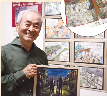
奥さまから「子ども部屋」と呼ばれる部屋で。手にするのは作品『火の用心、マッチ一本火事の元』