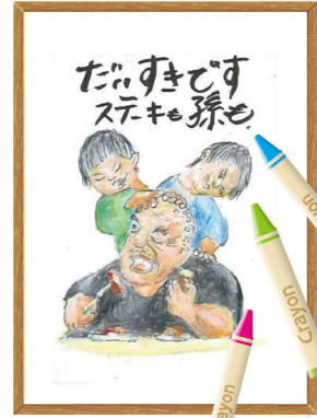
第3回湘南絵手紙作品展で湘南よみうり新聞賞を受賞した作品とその下書き