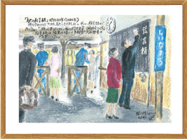
携帯電話がない頃、待ち合わせは駅が多かった。会えない時には駅の伝言板に残していた