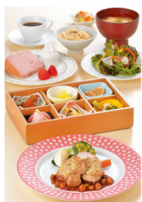
亜希子の夕食膳コース2,780円(税別) ※写真はイメージ

旬の食材をたっぷり使ったヘルシー志向の料理を食べて、体の内側から健康で美しくなるよ!