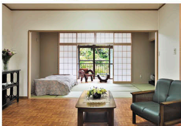
※居室は全室50㎡以上、南向き、ご夫婦での入居可能

湘南の海のほど近く、大磯町の介護付き有料老人ホーム「富士白苑大磯コーポ」。全室南向きで明るく、一部屋の広さは50.02~55.20㎡とゆったりとした空間で健康な方はもちろん、要介護5の方まで安心して快適に暮らしていただけます。お1人での入居はもちろん、ご夫婦・親子・ご兄弟姉妹2名さままでのご入居にも対応。法人設立以来50年以上にわたり特別養護老人ホームやデイサービスを運営し、総合的な福祉サービスを展開する富士白苑だからこそ得られる安心感があります。