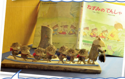
絵本を題材に細部までこだわり作品を仕上げる