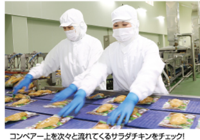
コンベア上を次々と流れてくるサラダチキンをチェック!