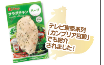
テレビ東京系列「カンパリア宮殿」でも紹介されました!