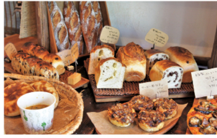
カレーとナン(前列左)や型焼きパン(後列右)なども好評。13時頃までは比較的品数も多く揃う。お出かけはお早めに