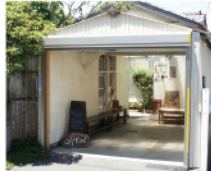
入口の立看板が目印

店の場所はちょっとわかりづらい。が、細い路地を進み、たどり着いた時の喜びはひとしおだ。