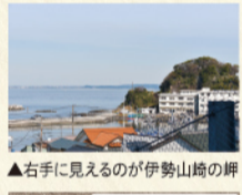
▲右手に見えるのが伊勢山崎の岬