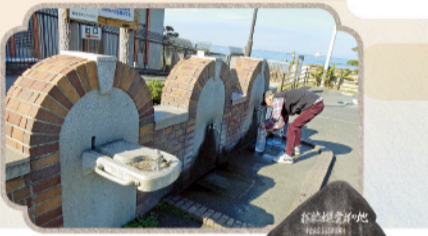
▲駐車場敷地内にある水栓から湧水「ヴェルニーの水」が飲める ▲「横須賀水道発祥の地」碑