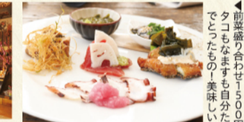
▲前菜盛り合わせ1,500円。タコもなますも自分たちでとったもの。美味しい!!

DATA かねよ食堂 □横須賀市走水1-6-4 ☎046(841)9881 □11時～18時(金・日～22時) 月曜休