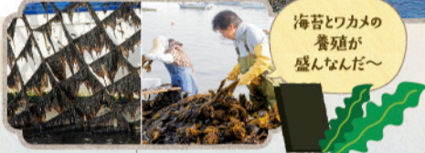
海苔とワカメの養殖が盛んだ～

明治9年フランス人ヴェルニーの指揮のもと整備された、横須賀製鉄所の用水に始まる水源地。昔から走水の湧水は豊富でミネラルを含んで美味しいと外国船にも好評だった。水量は一日約1,000㎡。