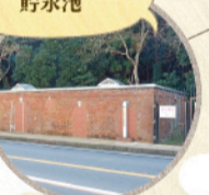
▲国登録有形文化財だ