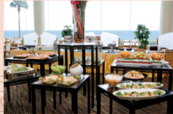
ティータイムにデザートセットはいかが